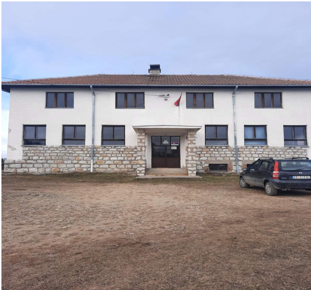
Слика број 3

Издвојено одељење Звјезд има две учионице, кухињу са трпезаријом (није у функцији због малог броја ученика), стан за наставника и мало школско двориште без спортски терена. У згради не постоји мокри чвор, а грејање је на чврсто гориво. Објекат је у добром стању и удаљен је од матичне школе 9 км.