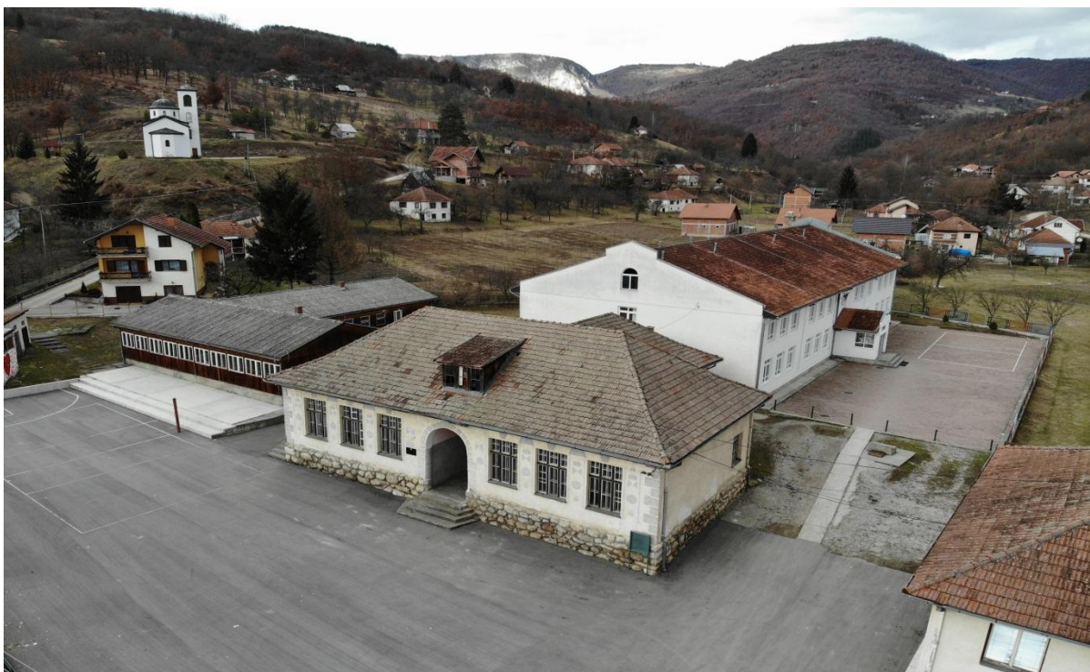
Слика број 1

ОШ "Михаило Баковић" има своју дугу историју. Почела је са радом 1871. године у конаку Манастира у Сељанима, а 1927. године наставља своју мисију у новоизграђеној школској згради у Сељашници ( слика број 1).