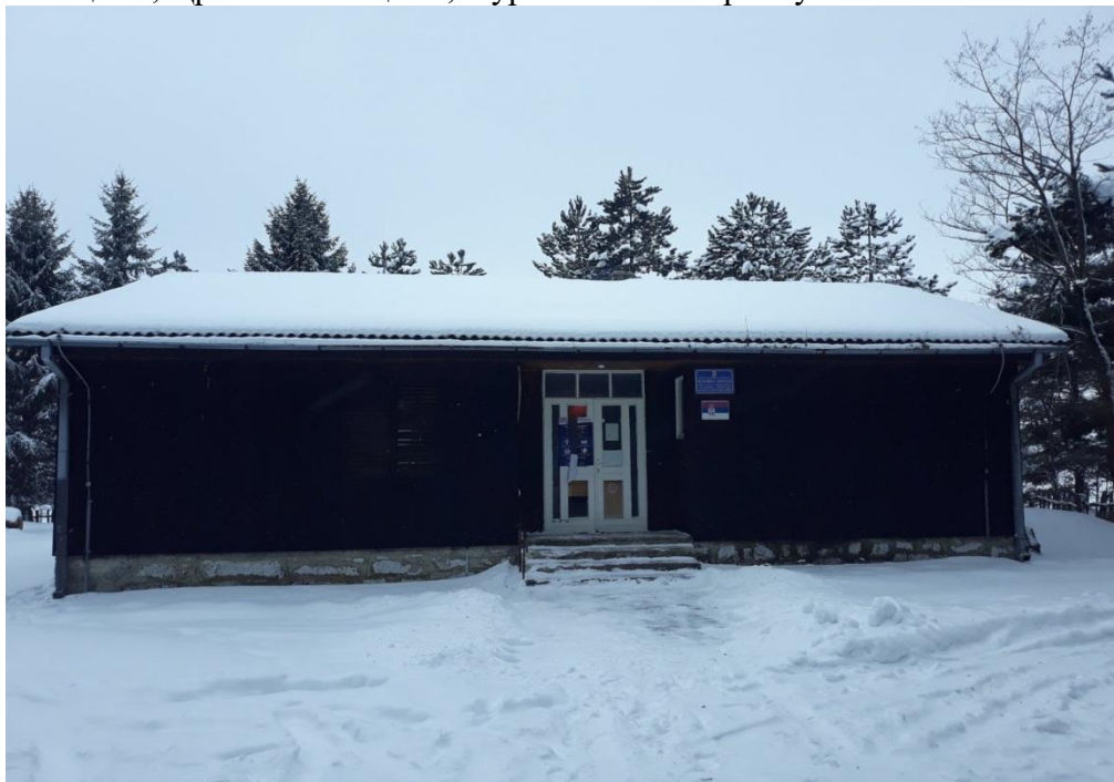
Слика број 6

Поред школе у Доњим Бабинама и Горњим Бабинама, постоје и школски објекти у Забрдњим Тоцима, Црквеним Тоцима, Турашићима и Врбову.