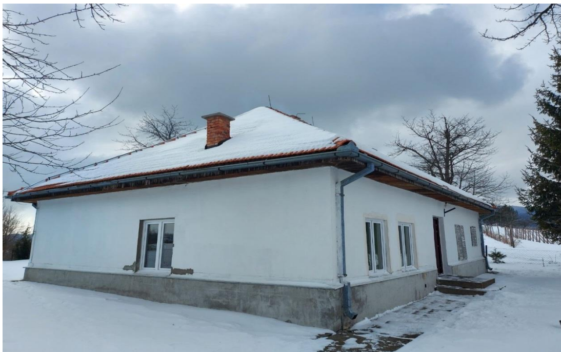
Слика број 4

Издвојено одељење Карошевина удаљено је од матичне школе 15 км, а располаже са једним објектом од тврдог материјала и малим школским двориштем. Има две учионице, канцеларију и оставу. Мокри чвор је ван објекта, а грејање на пећи на чврсто гориво (слика број 4)