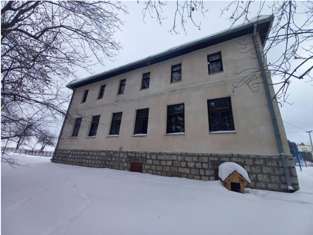
Слика број 5

Школска зграда у Горњим Бабинама је монтажна, изграђена 1975. године. Сређена је тако што је премазана ламперија, президани оцаци, премазани зидови, прозори, врата, подови и ограђено двориште тако да је то сада лепа и функционална зграда слика број 6.