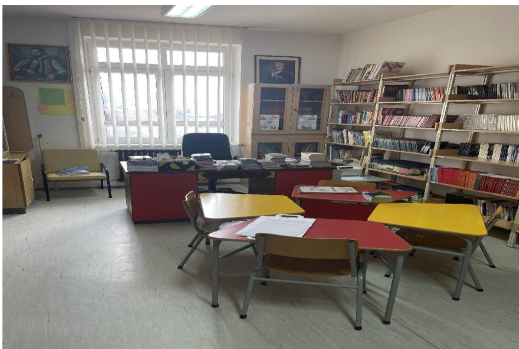
Слика број 2

Библиотека у матичној школи задовољава потребе ученика и наставника, располаже са око 10 000 наслова (слика број 2)